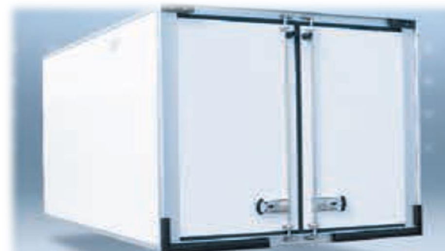
Композитні панелі (харчовий гелеобразний шар - полієфір - поліуретан), оснащені алюмінієвими вставкам