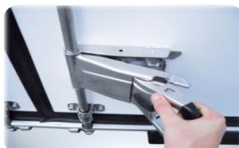
Нова ручка "Easy Handle" з одним рухом, на задніх дверях