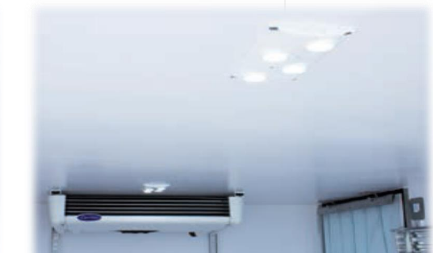
Світлодіодний світильник з перемикачем всередині кабіни

* Всі зображення автомобіля, кузова та салона наведені як приклад і можуть відрізнятися від фактичного